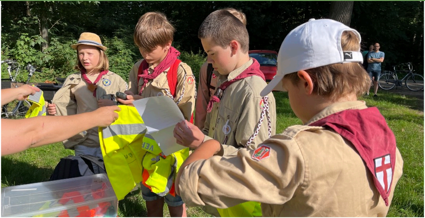
Scouts vertrekken naar Borculo.