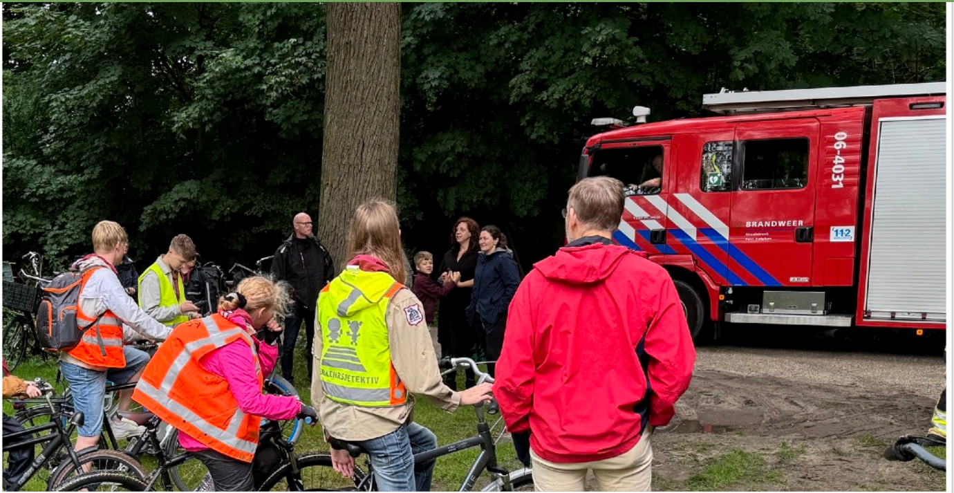
St. Joris vertrekt onder begeleiding op Zomerkamp